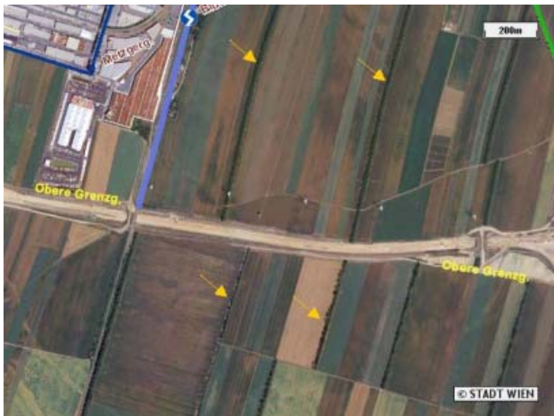
Abb.4 Untersuchungsgebiet Goldberg (Pfeile kennzeichnen die begangenen Windschutzstreifen. Vögel im Areal zwischen den beiden Hecken wurden miterfasst.)

Zwölfer H., Bauer G., Heusinger G. (1981): Ökologische Funktionen von Feldhecken – Tierökologische Untersuchungen über Struktur und Funktion biozönotischer Komplexe Abb.3 Untersuchungsgebiet Rothneusiedl (Pfeile kennzeichnen die begangenen Windschutzstreifen. Auf der Abbildung ist die S1 gerade in Bau.)